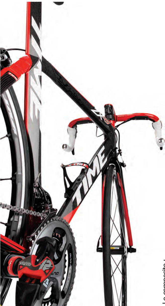
Le composite : cadres, fourches, potences, cintres, ... en carbone.