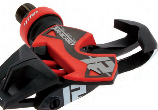
Les pédales automatiques.